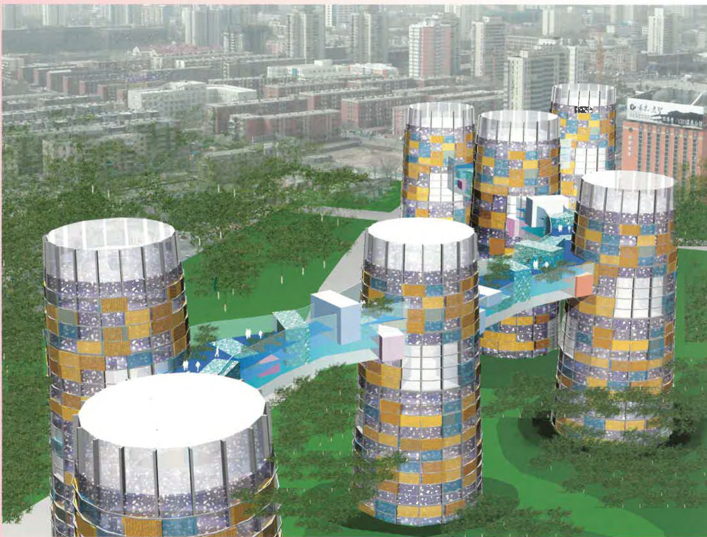
Les Microcities dans Pékin